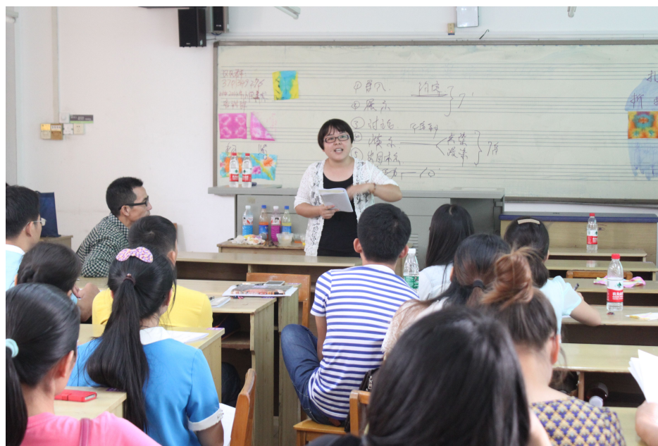
学员进行精彩互动讨论

课后，学员老师与一线专家针对观摩课现场情况进行了评课，学员老师们纷纷表示受益良多，并对美术欣赏课常出现的问题进行了深入探讨，并交换了教学意见，整个教学观摩活动在互相学习互相促进的氛围下圆满结束。